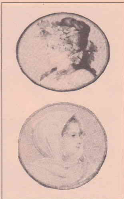
Deux des médaillons peints par A. Bachelin au «Salon des Quatre Saisons»